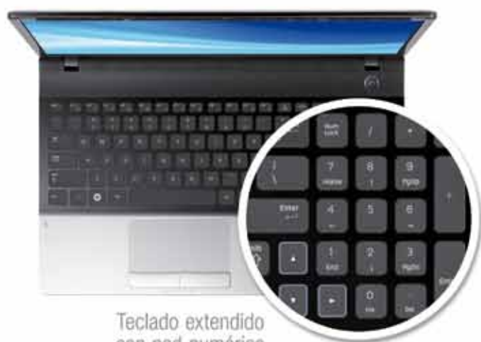
Teclado extendido con pad numérico