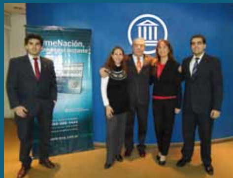
Gerencia Zonal Mendoza Este

Lo bueno de compartirlo es reconocer que la relación entre el Banco Nación y las pymes se afianza día a día, generando un vínculo que se construye con seriedad, respaldo y respeto, elementos que nos permiten seguir siendo elegidos.